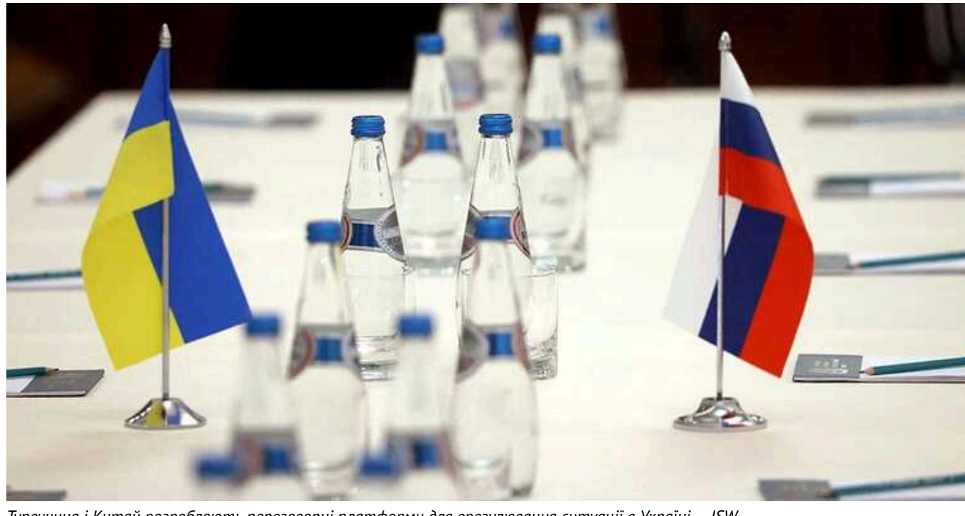
Туреччина і Китай розробляють переговорні платформи для врегулювання ситуації в Україні, – ISW

Судячи з усього, Туреччина та Китай розробляють власні переговорні платформи для "врегулювання ситуації в Україні". Кремль, найімовірніше, скористається ними, щоб просувати свої давні нарративи щодо переговорів та війни.