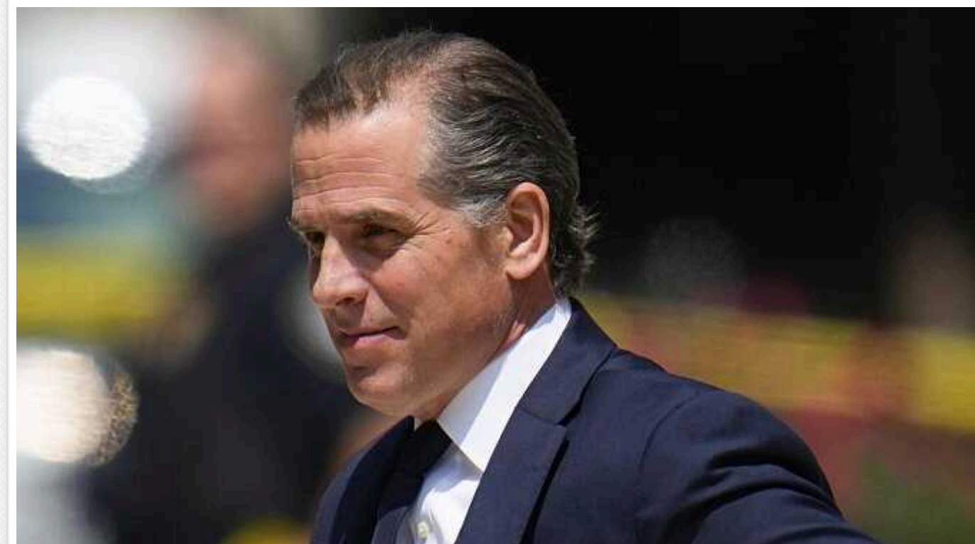
Хантер Байден дав свідчення в Конгресі: обійняв в 2014 році посаду в компанії Burisma для «боротьби з російською агресією»

Хантер Байден у Конгресі дав свідчення перед комітетами Палати представників щодо нагляду та судової системи. Допит проходив за зачиненими дверима.