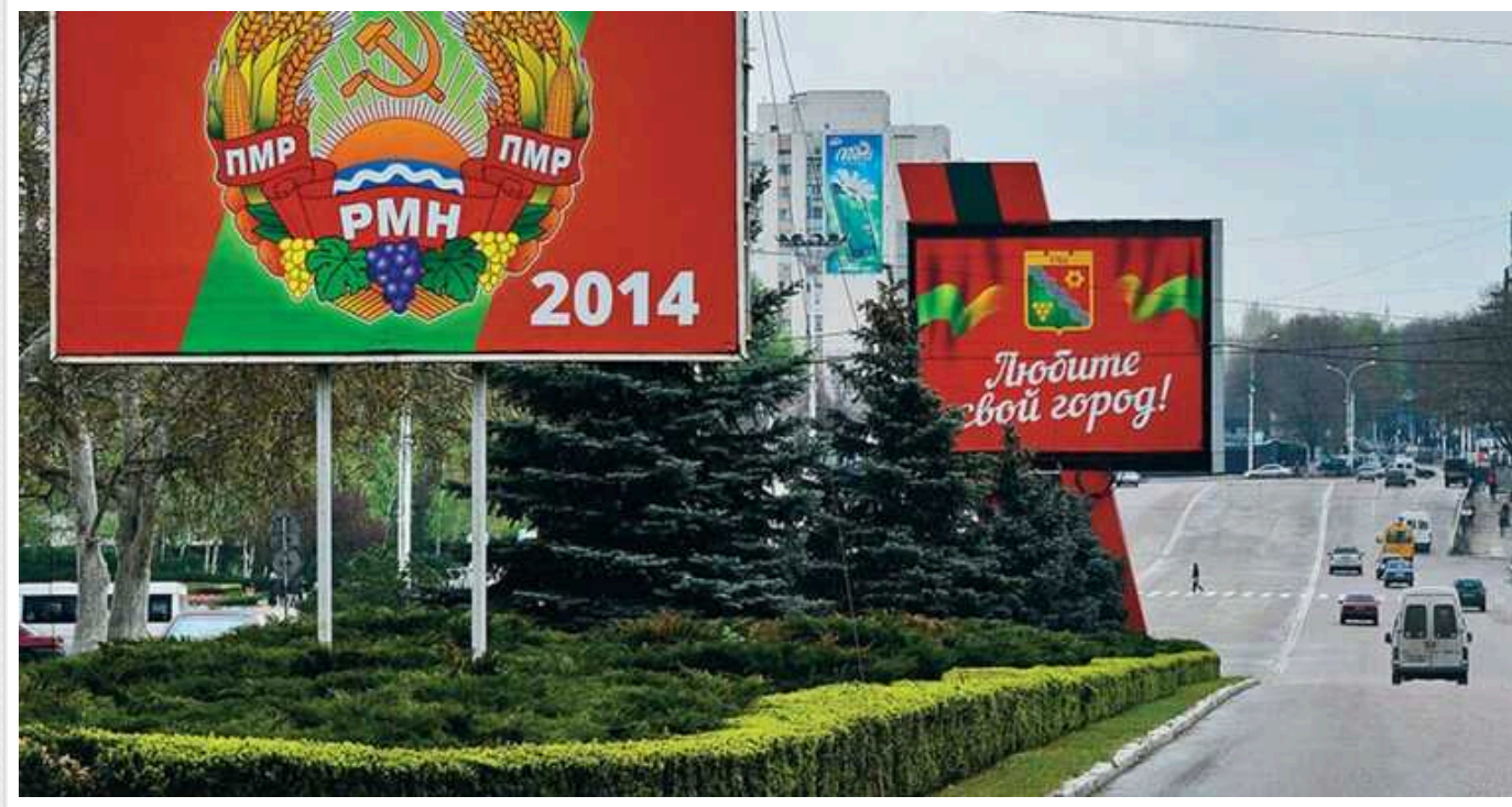
В ISW пояснили, що стоїть за зверненням «депутатів» незвіданого Придністров'я до РФ: Кремлю потрібне «виправдання»

Сьомий з'їзд депутатів незвіданого Придністров'я від 28 лютого ухвалив рішення, спрямовані на те, щоб надати Росії виправдання широкого спектру можливих ескалаційних дій проти Молдови. Кремль може здійснити їх негайно або у довгостроковій перспективі, хоча не виключено, що диктатор Володимир Путін відповість на запити ПМР під час свого виступу у Федеральних зборах 29 лютого.