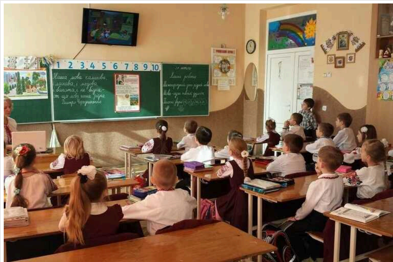
МОН: Усі освітні заклади на захід від Києва мають перейти на офлайн-навчання

Заступник міністра освіти та науки України Михайло Вінницький повідомив, що до вересня 2024 року всі навчальні заклади, які розміщені на захід від Києва, мають вийти до офлайну. За його словами, у деяких випадках доведеться навчатися у дві зміни чи ввечері, проте для Кабінету міністрів очне навчання – це величезний пріоритет.