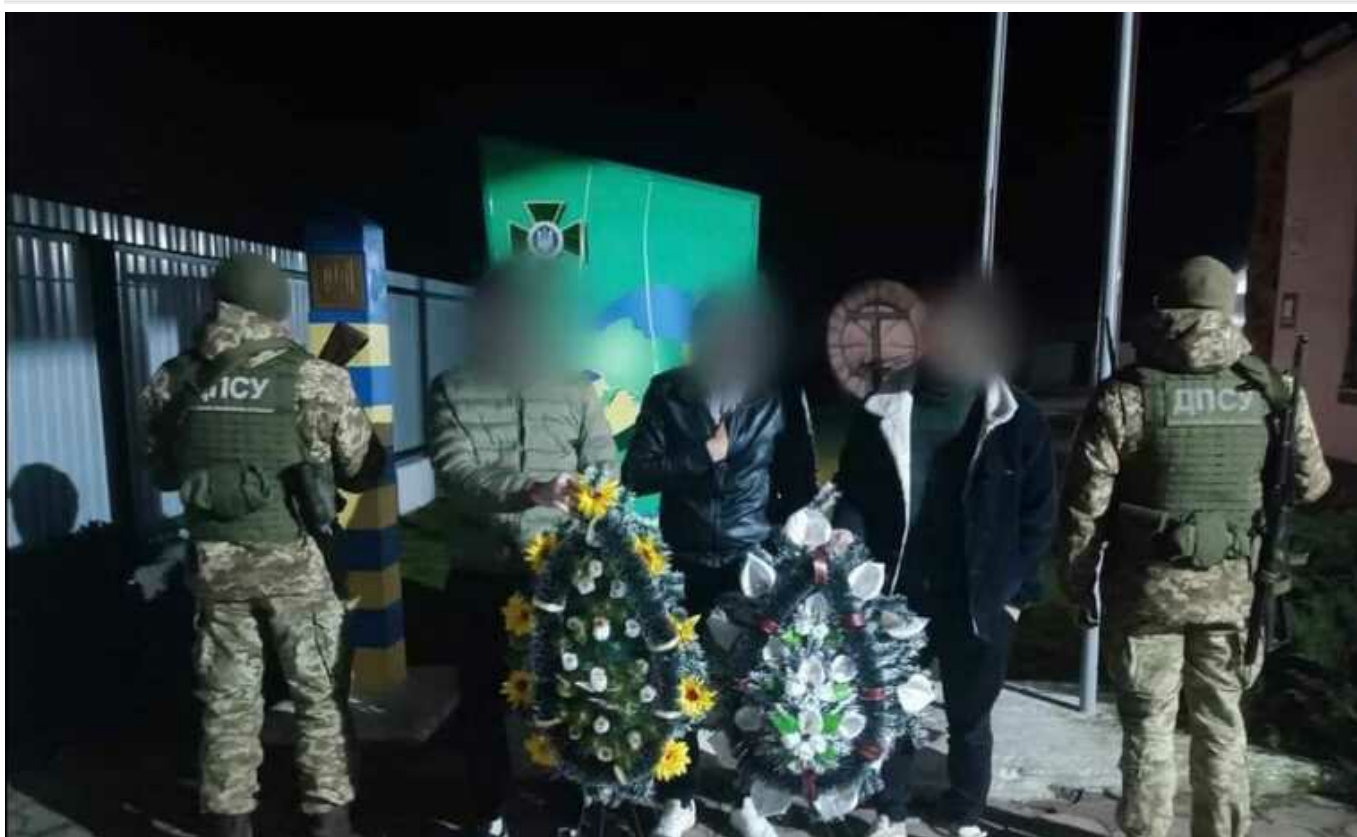
Двоє харків'ян намагалися перетнути кордон із похоронними вінками