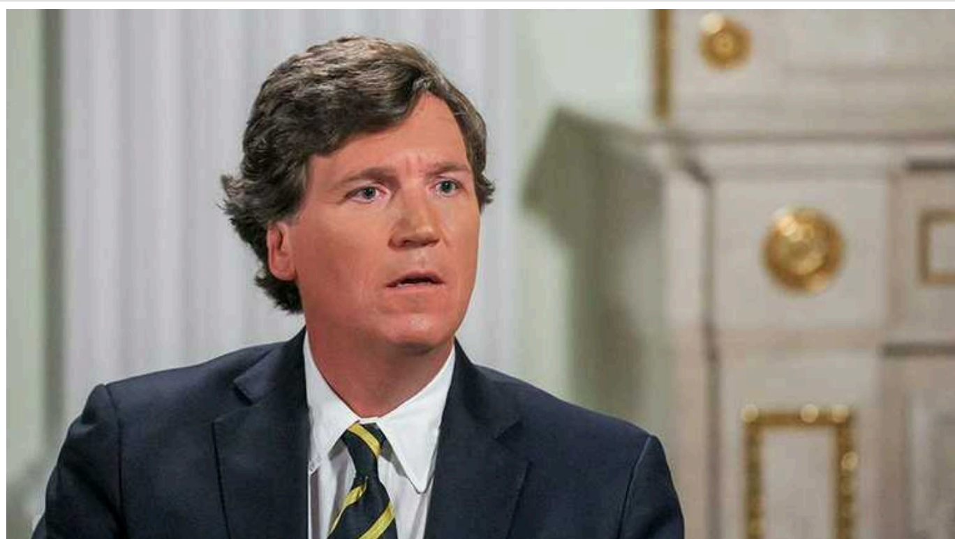
Такер Карлсон: За смертю Навального стоїть Україна, бо "їй це вигідно"

Такер Карлсон, наслукавшись Путіна, припустив, що за смертю Навального стоїть Україна, бо "їй це вигідно".