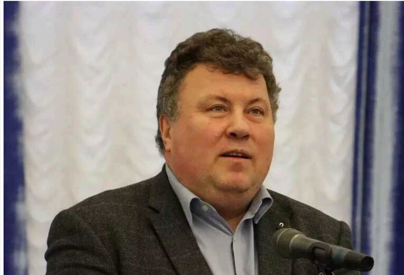
ЗМІ знайшли в ректора КНУ Бугрова елітну квартиру, яка не відповідає його доходам

Журналісти дізналися, що ректор Київського національного університету імені Тараса Шевченка Володимир Бугров став власником квартири в елітній столичній новобудові, на яку задекларованих коштів не вистачило би. Сам ректор заявив, що грошей у нього було достатньо, та звинуватив журналіста у втручанні в особисте життя.