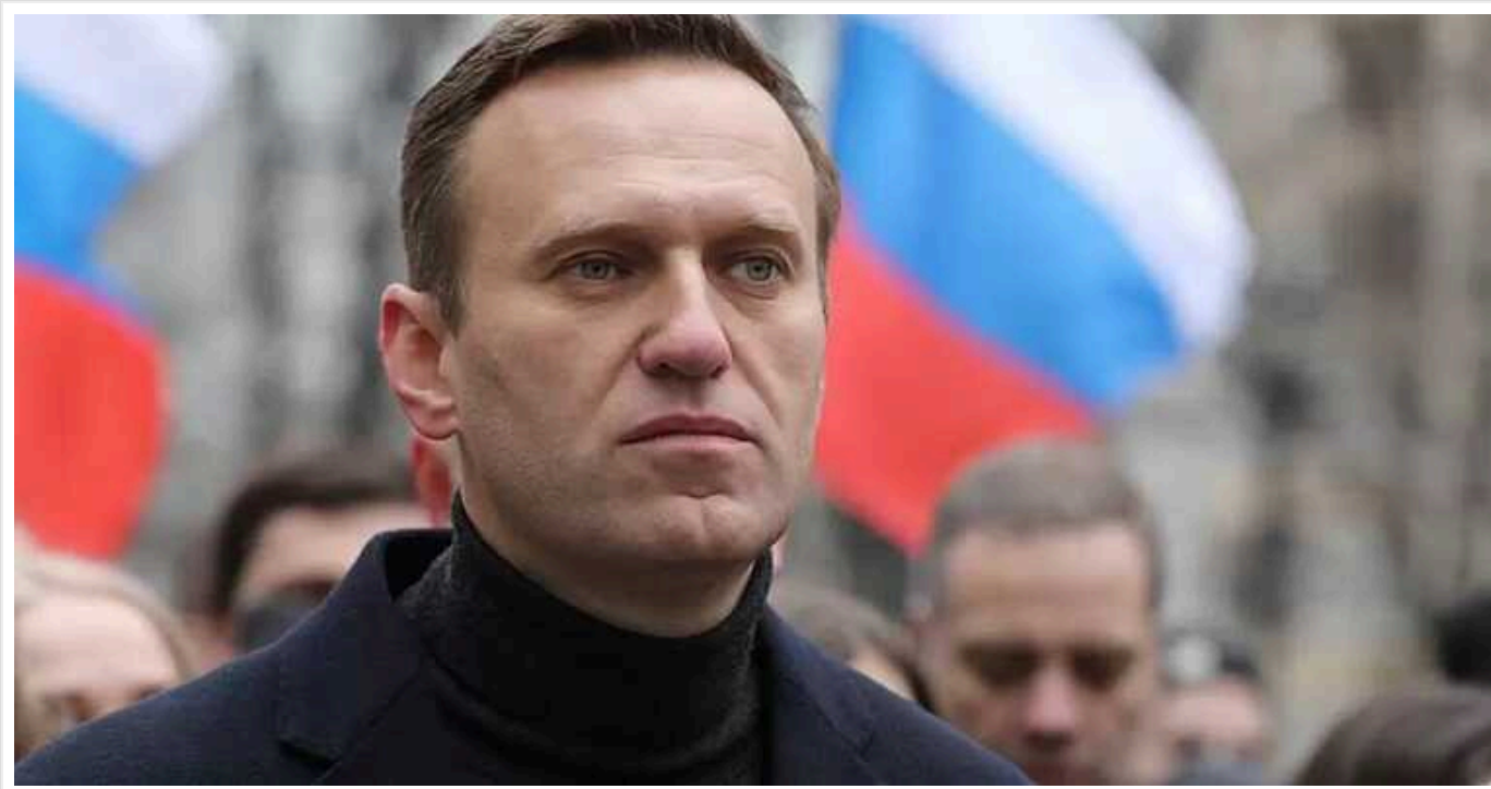
8 країн ЄС закликали запровадити санкції проти РФ через смерть Навального, – Reuters

Вісім країн Європейського союзу вимагають запровадити санкції проти російських суддів та прокурорів через смерть опозиціонера Олексія Навального.