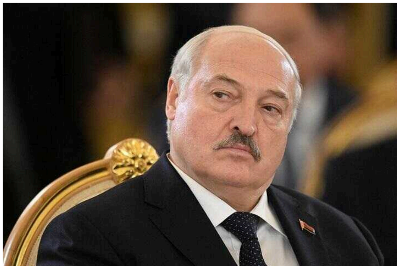
Білоруські емігранти готують переворот проти Лукашенка, - Politico

Білоруська група опору ВУРОЛ, що діє з Польщі, готує державний переворот проти режиму самопроголошеного президента Олександра Лукашенка.