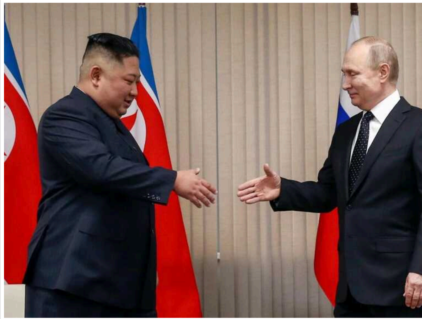
Із Північної Кореї до Росії доставлено понад 2,5 мільйони боєприпасів, - ЗМІ

Вашингтонський Центр стратегічних і міжнародних досліджень (CSIS) повідомляє, що з КНДР до Росії доставлено понад 2,5 млн. боєприпасів.