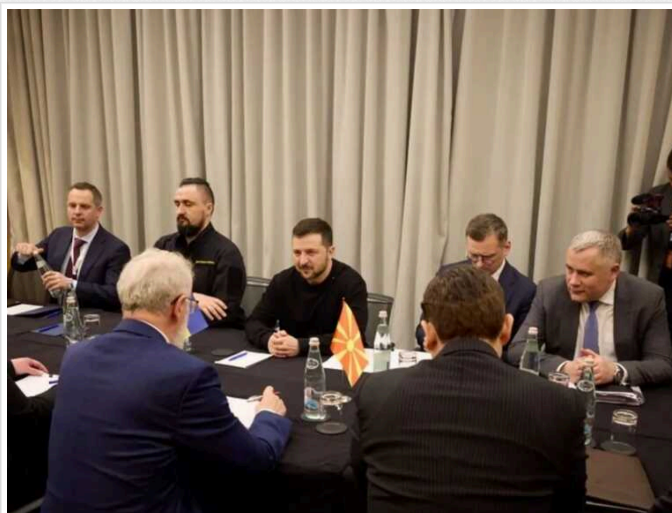
Лідери країн Південно-Східної Європи підписали декларацію на підтримку України: проти Путіна виступив навіть Вучич

На саміті "Україна - Південно-Східна Європа", що проходить у Тірані (Албанія), учасники підписали спільну декларацію. В заході взяли участь лідери Сербії, Північної Македонії, Косова, Боснії і Герцеговини, Молдови, Болгарії та Чорногорії.