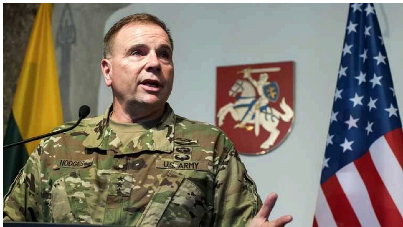
Генерал Годжес дав прогноз про напад РФ на НАТО

У разі перемоги в Україні Росія буде наступати на країни Балтії або іншу державу НАТО, упевнений ексоловнокомандувач збройними силами США в Європі, генерал-лейтенант у відставці Бен Годжес.