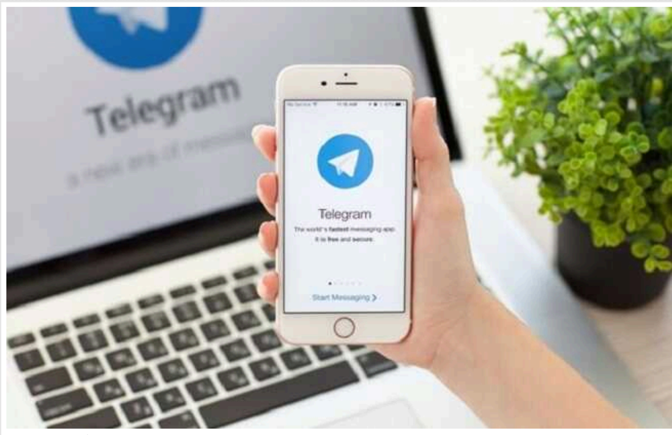
У ВР хочуть заборонити Telegram в Україні

На круглому столі у комітеті Верховної Ради сьогодні вирішили, що потрібно шукати метод, як заборонити Telegram в Україні, – офіційний сайт Парламенту.