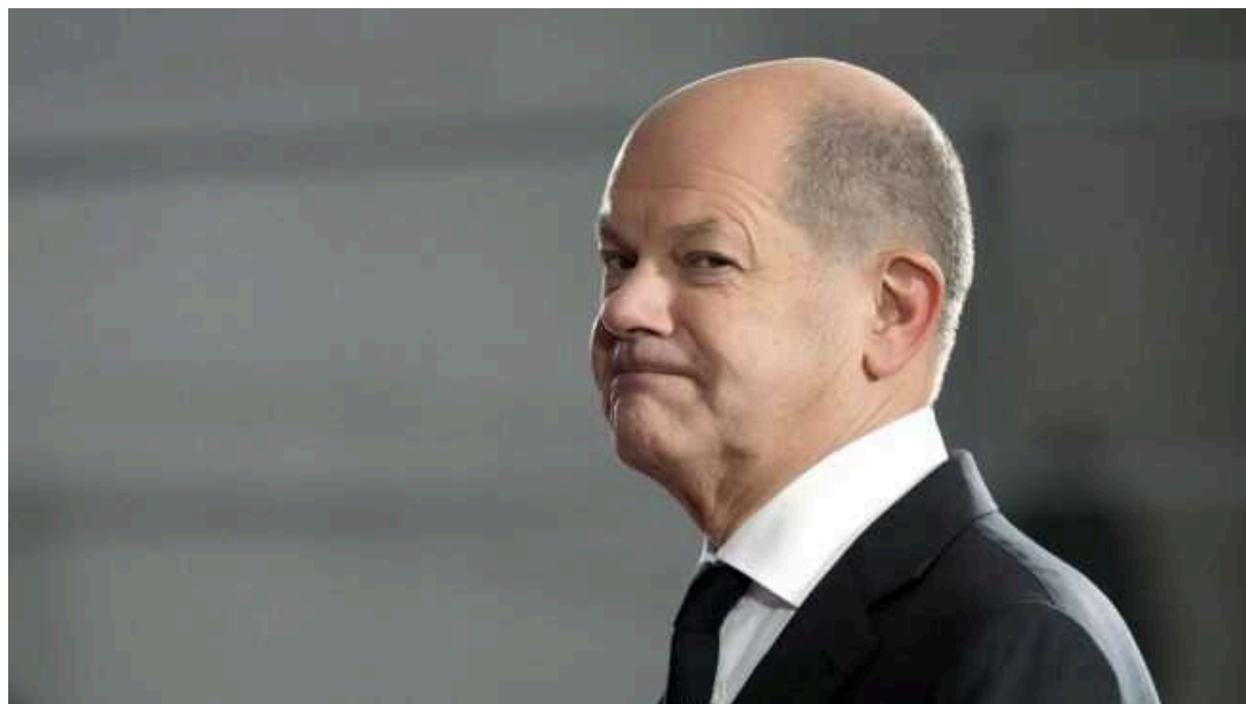
НАТО не стане стороною конфлікту в Україні, - Шольц

Канцлер Німеччини Олаф Шольц у своєму відеозверненні заявляє, що НАТО не стане стороною конфлікту в Україні, німецьких солдатів не буде відправлено до України.