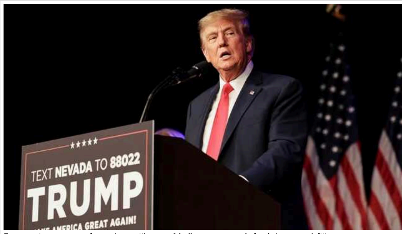
Трамп у разі перемоги на виборах очікує, що Німеччина буде більш прихильною до Заходу і насамперед США

Соратник Трампа розповів, чого колишній американський президент у разі перемоги на виборах чекатиме від Німеччини "повернутись від Китаю до США".