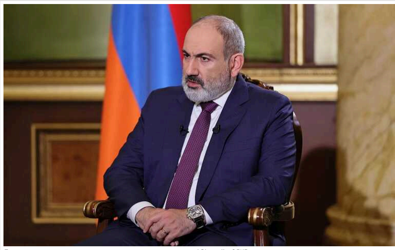
Пашинян пояснив, що означає оголошена ним «заморозка» участі Вірменії в ОДКБ

Прем'єр-міністр Вірменії Нікол Пашинян заявив, що заморозка участі країни в Організації договору про колективну безпеку (ОДКБ) означає відсутність постійного представника від Вірменії, а також неучасть у заходах на високому та вищому рівні.