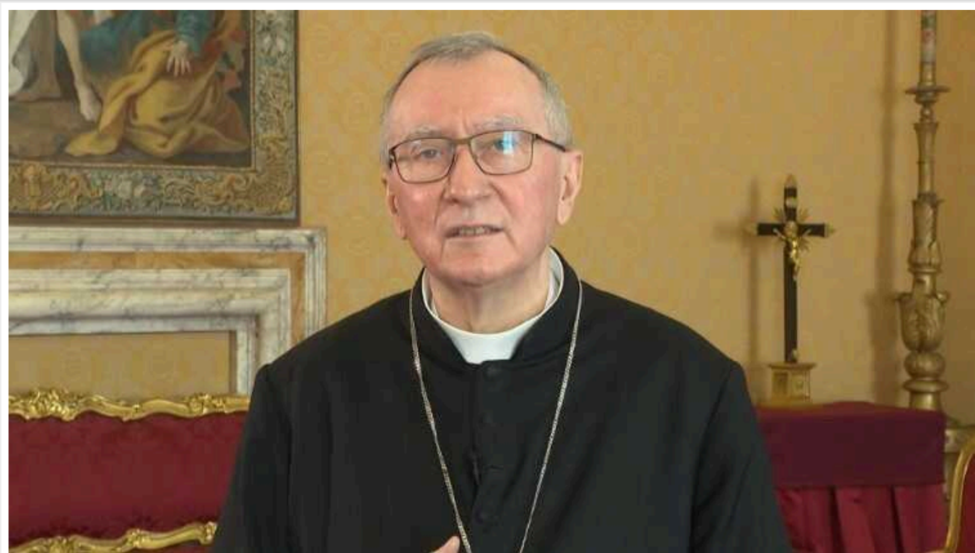
Пропозиція Макрона про те, що Європа може направити війська в Україну, відкриває "страхотливий сценарій", - Ватикан

Держсекретар Ватикану кардинал П'єтро Паролін заявляє, що пропозиція Макрона про те, що Європа може направити війська в Україну, відкриває "страхотливий сценарій".