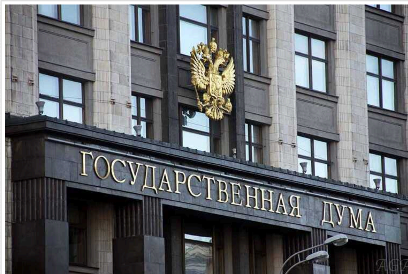
На прохання "Придністров'я" про "допомогу", у Держдумі пообіцяли розглянути звернення і провести консультації з Путіним і МЗС

У РФ відповіли на прохання "Придністров'я" про "допомогу". У Держдумі пообіцяли розглянути звернення і провести консультації з Путіним і МЗС.