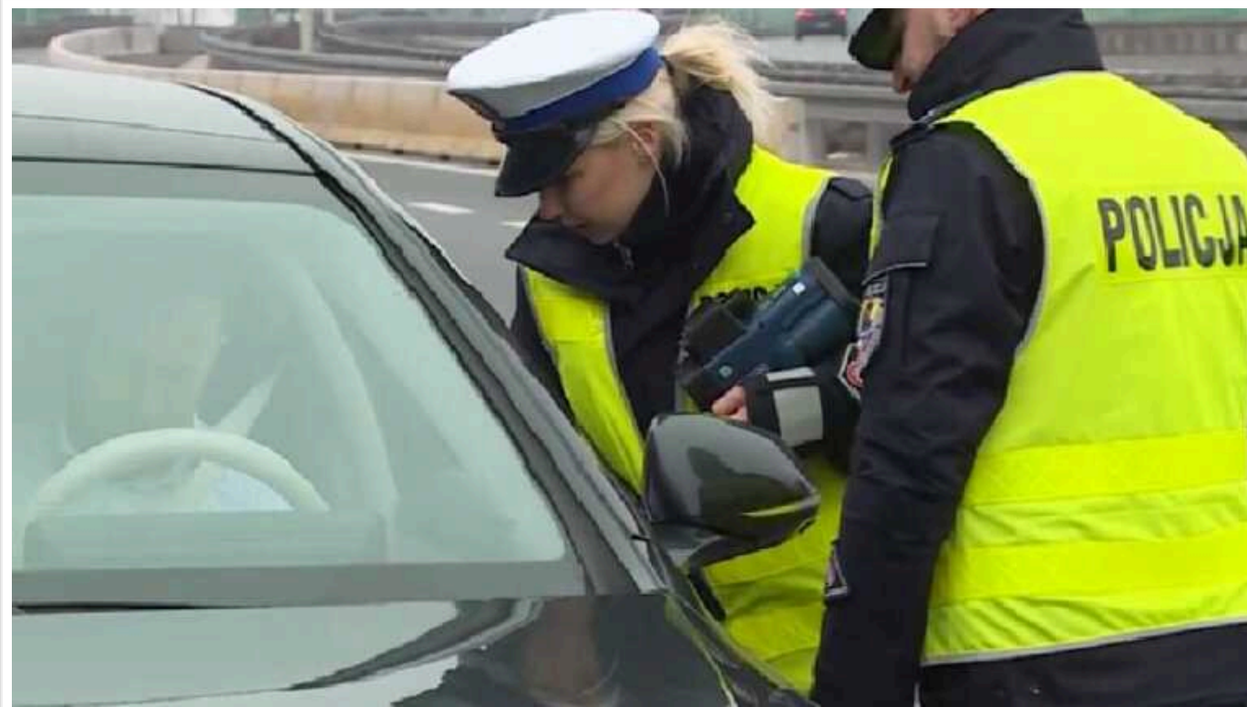
У столиці Польщі зґвалтували громадянку Білорусі, а не українку, - ЗМІ

Польське видання Fakt повідомляє, що у Варшаві на очах перехожих зґвалтували не українку, а білоруску.