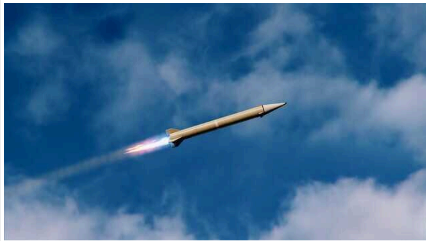
Окупанти готуються до масованого ракетного обстрілу України: на аеродромі «Енгельс-2» з'явилося ще 5 додаткових літаків