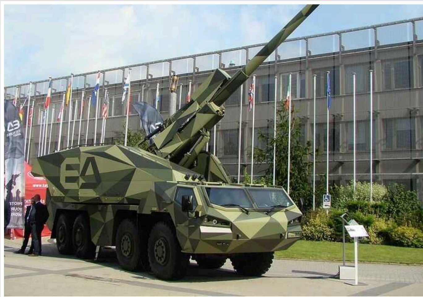
Нідерланди замовили для України гаубиці DITA у Чехії

Нідерланди замовили в Чехії новітні гаубиці DITA для подальшої передачі Україні. Ця гаубиця являє собою сучасну вогневу систему, здатну завдавати ударів по цілях на відстані десятків кілометрів.