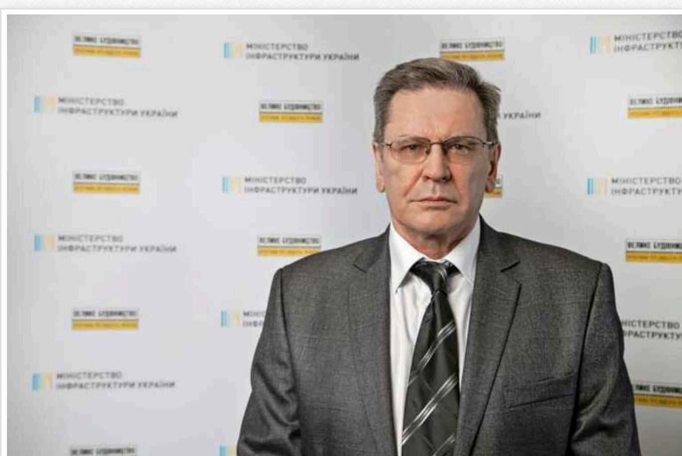
Заступник голови Держагентства відновлення та розвитку інфраструктури Кузькін потрапив у скандал

Заступник голови Державного агентства відновлення та розвитку інфраструктури Євген Кузькін потрапив у скандал на одному із робочих засідань. Чинovníк дозволив собі нецензурно висловлюватись у присутності підлеглих.