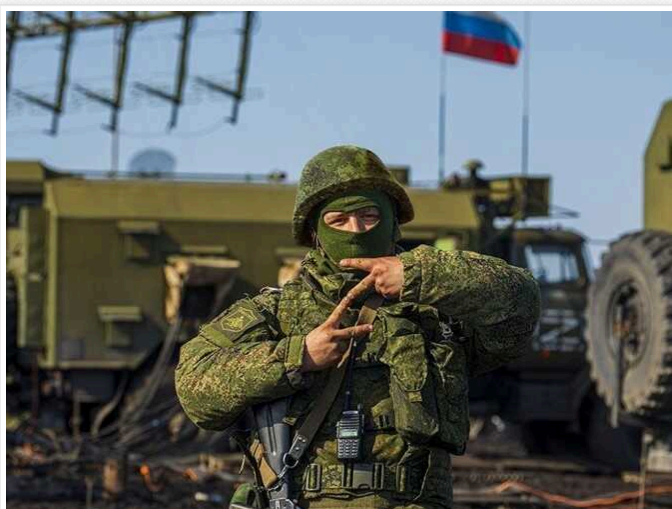
У Челябінській області вдові загиблого на війні окупанта видали пакет із макаронами й кількою

Росіяни, в якій чоловік-окупант "задвохотисяє" на війні проти України, а син також бере участь у повномасштабному вторгненні, подарували пакет із макаронами й консерву з кільки. Це сталося в селі Варна Челябінської області РФ.