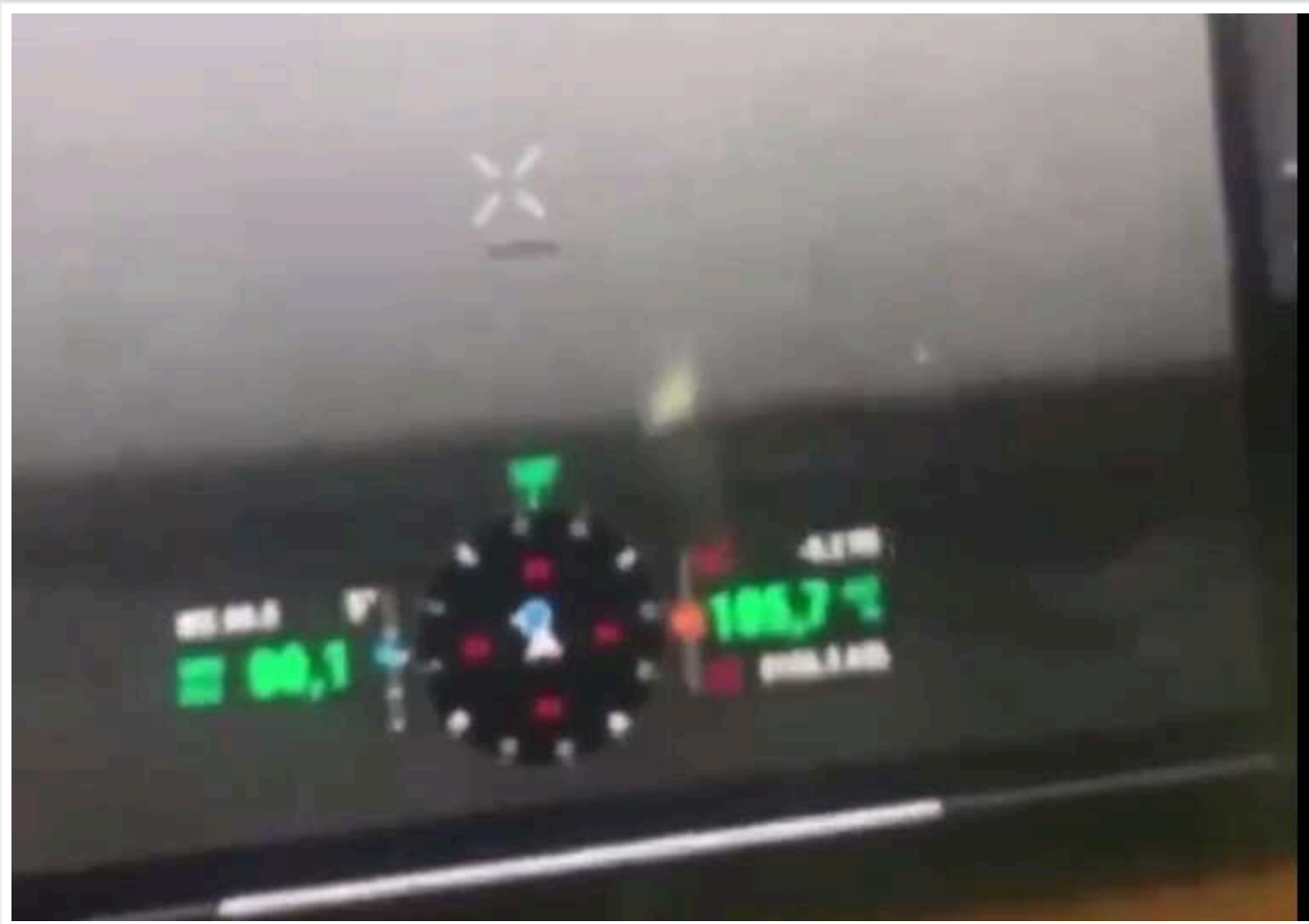
Українські військові зняли "абсолютно безшумний НЛО у формі диска", який завис над лінією фронту, - Daily Mail

Його помітили за допомогою дрону Mavic біля 406-го ОАБр цього місяця. Їхній дрон знаходився при цьому на висоті понад 150 метрів над рівнем моря.