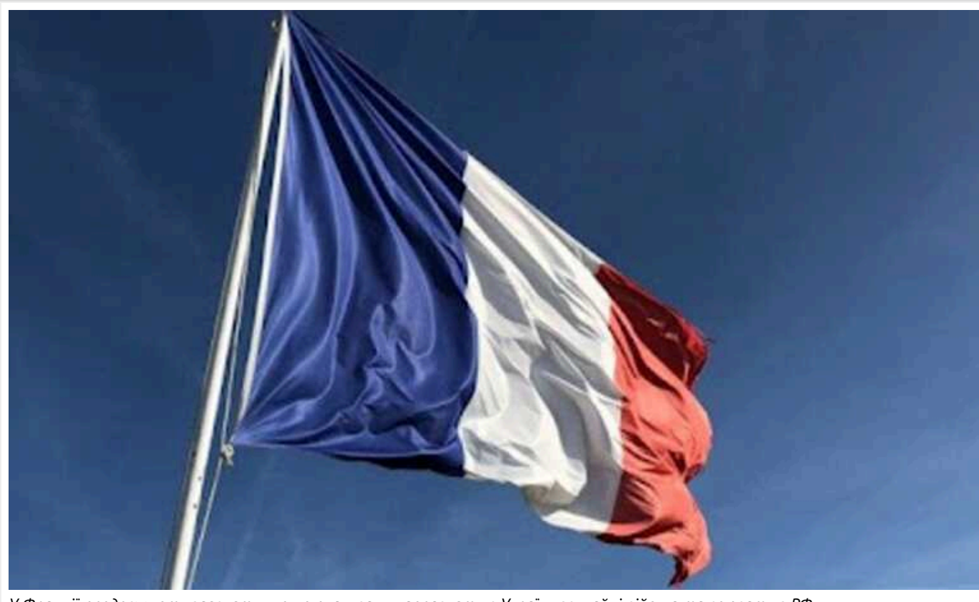
У Франції продовжують заявляти, що не планували направляти в Україну звичайні війська та воювати з РФ

Міністр закордонних справ Стефан Сежурне заявив про необхідність "розглянути нові дії на підтримку України", які "мають відповідати дуже конкретним потребам", але без "переходу порога воєвничості", передає BFM TV.