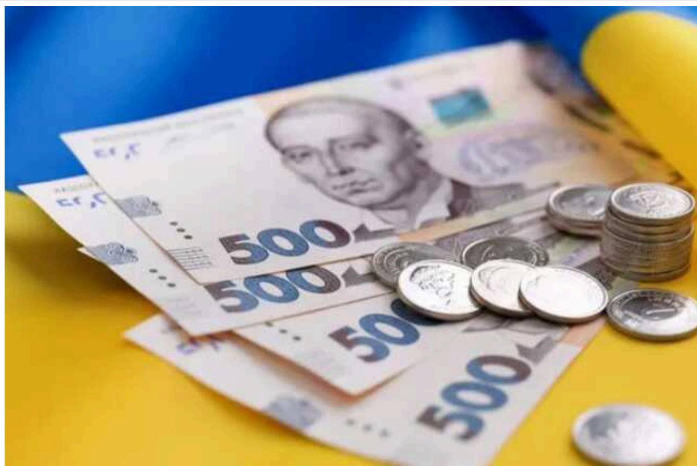
В яку суму обходиться Україні один народний депутат

Україна виділяє на оренду житла одному нардепу 37 тисяч 900 грн на рік, а на оплату проїзду їде 7500 грн щомісяця. Загалом один народний депутат обходиться в 1,6 млн грн податків на рік.