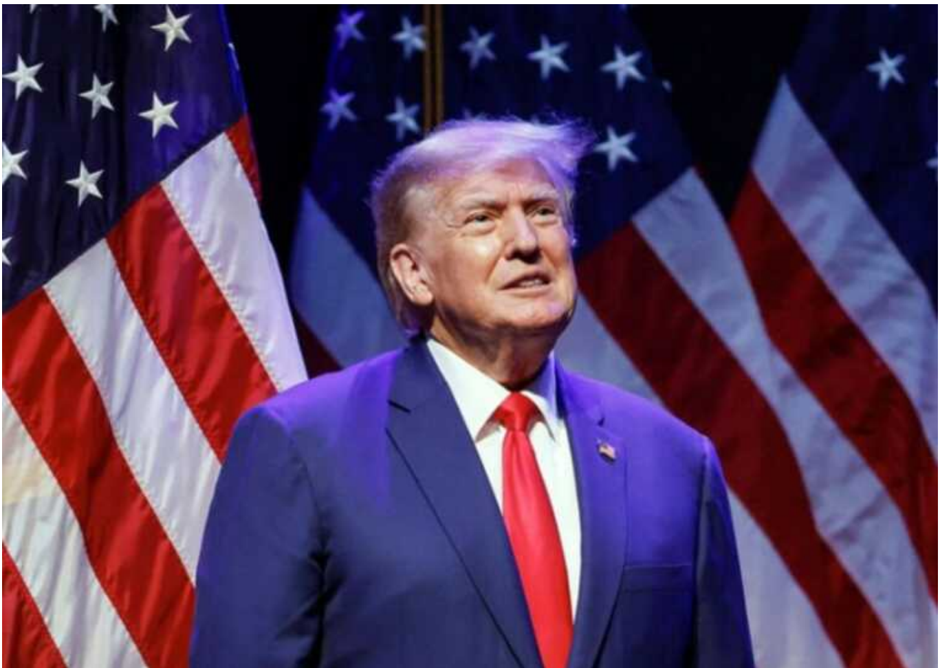
Трамп виграв праймеріз у штаті Мічиган

Дональд Трамп виграв праймеріз у Мічигані від Республіканської партії з великим відривом, зміцнивши лідерство у номінації від партії на президентських виборах. Ніккі Гейлі, його остання суперниця, що залишилася, посіла друге місце.