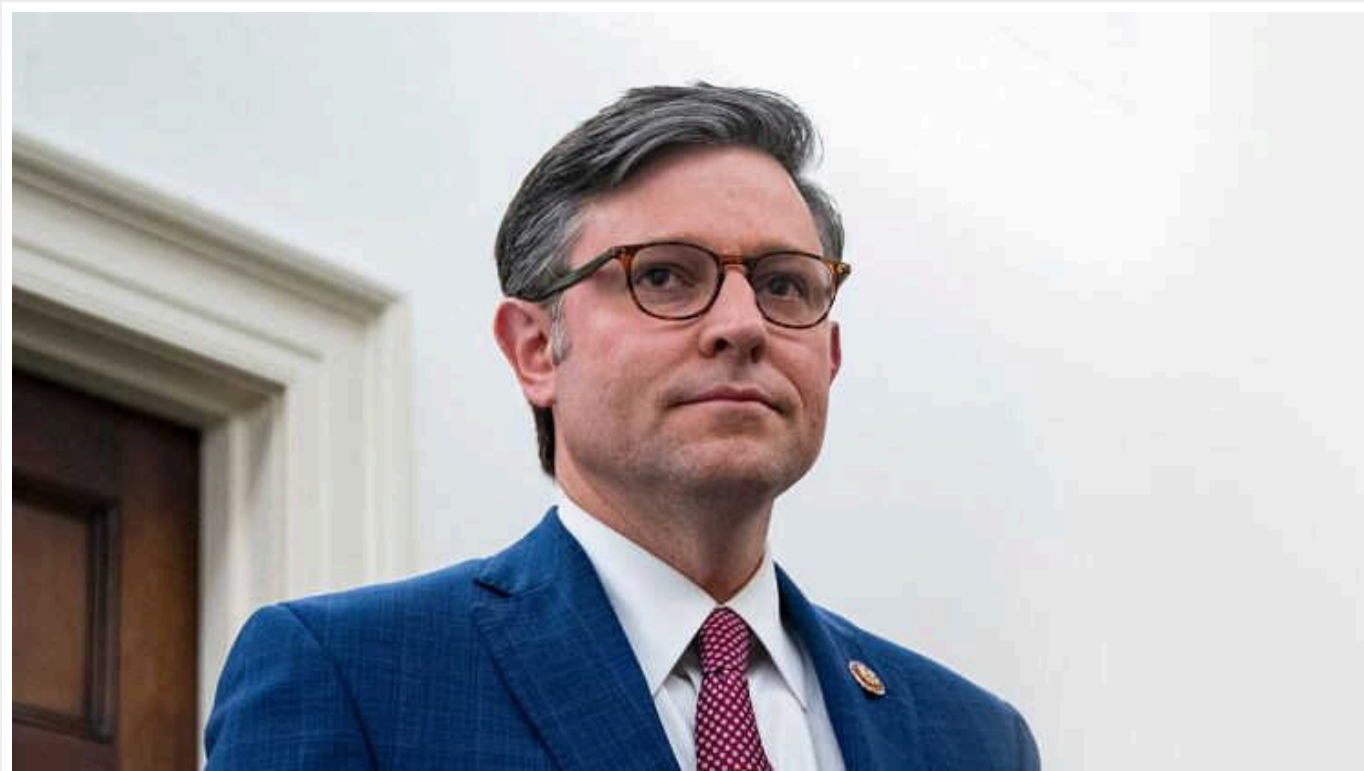
Співкери 23 парламентів звернулися до Джонсона із відкритим листом

Співкери 23 парламентів та голова Європарламенту Роберта Метсола звернулися з відкритим листом до спікера Палати представників США Майка Джонсона про підтримку допомоги Україні. Ініціатором його став голова Верховної ради Руслан Стефанчук.