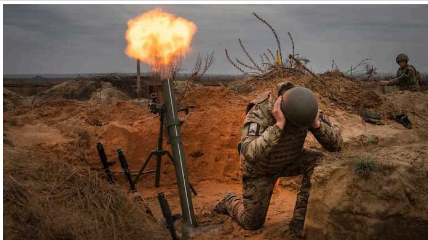
Україна навряд чи зможе здійснити новий контрнаступ до пізнього літа, - командувач ЗС Британії Радакін

Україна зіткнулася зі складною ситуацією на полі бою через нестачу боєприпасів. У такому невигідному становищі країна перебуватиме протягом декількох місяців, поки Захід не погодить подальші кроки на підтримку Києва.