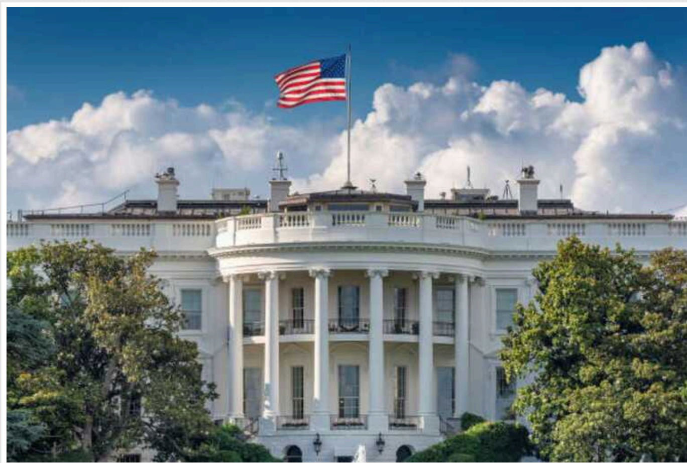
США не відправлятимуть війська в Україну – Білий дім

США не відправлятимуть війська для участі у бойових діях в Україні, заявив Білий дім після того, як президент Франції Еммануель Макрон відмовився виключити відправлення західних військ.