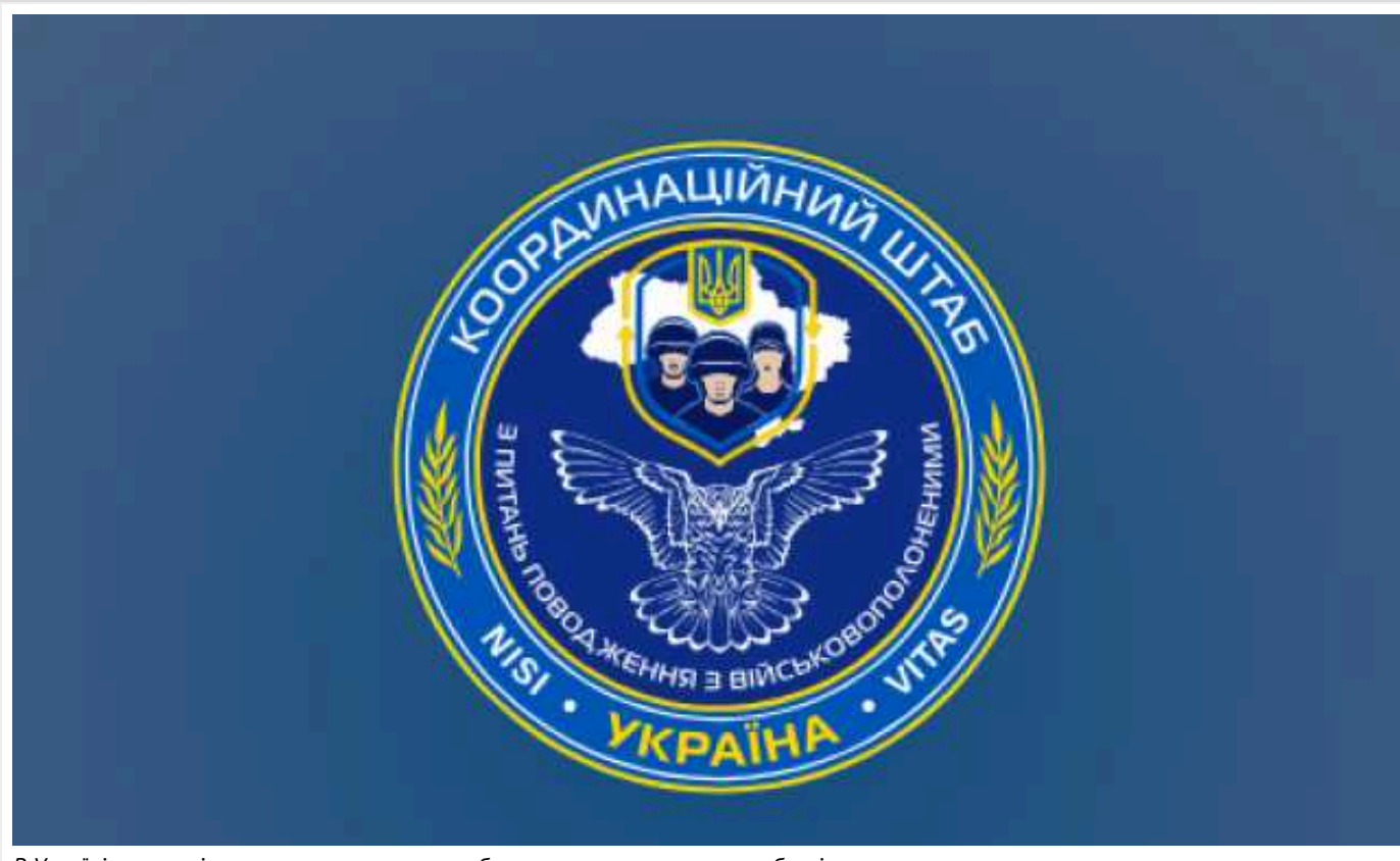
В Україні нарешті створюють електронну базу полонених та зниклих безвісти

Кабінет Міністрів України вчора, 27 лютого, ухвалив постанову, яка затверджує положення про інформаційну систему з питань поводження з полоненими.