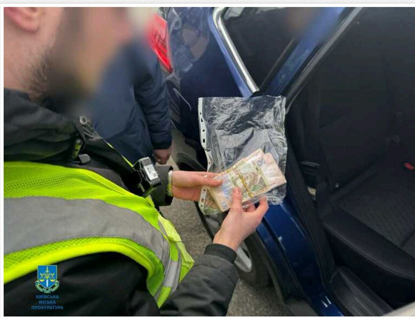
У Києві на хабарі затримали директора департаменту "Укрнафти"

Директору департаменту ПАТ "Укрнафта", який вимагав 160 тис. гривень за допомогу в оформленні договорів користування землею, повідомлено про підозру. Наразі вирішується питання щодо обрання запобіжного заходу.