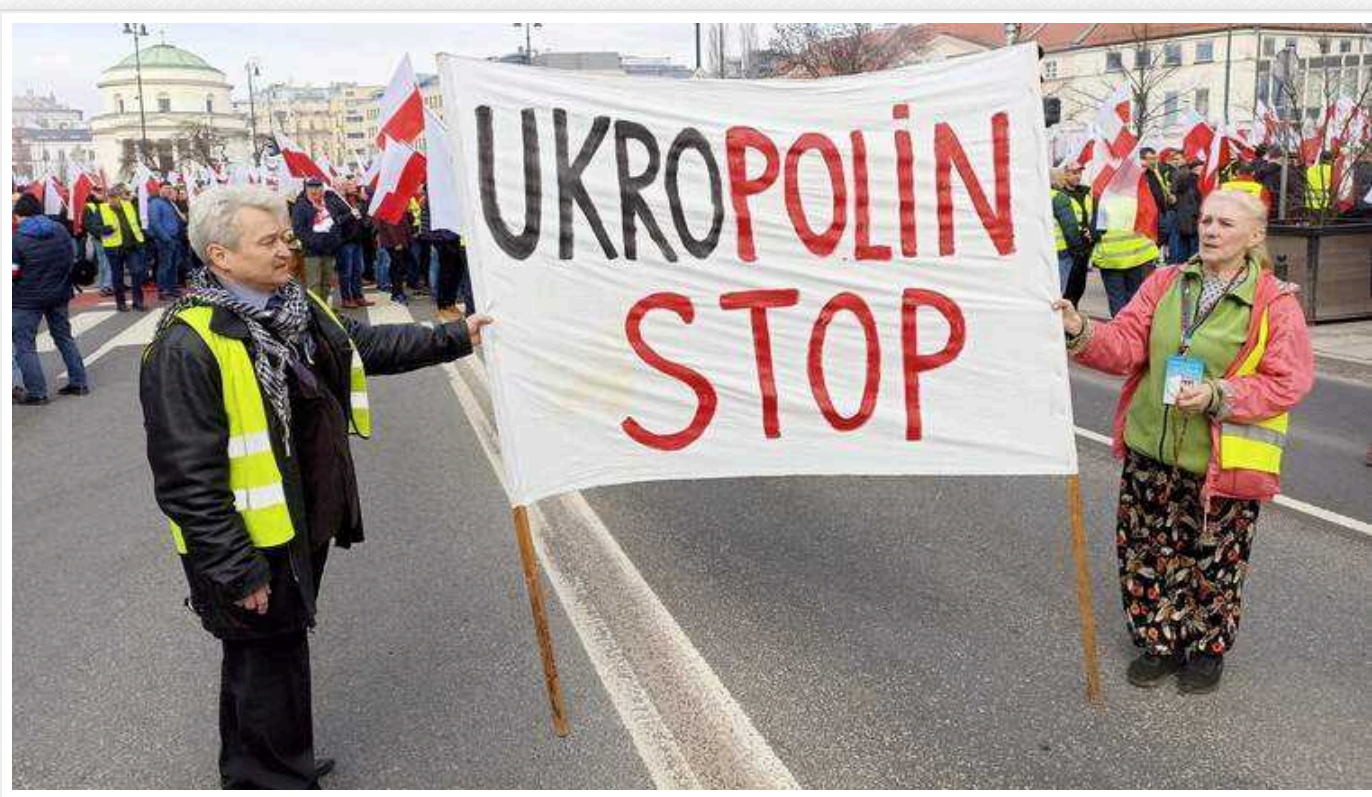
До протесту польських фермерів у Варшаві приєдналися проросійські політики та активісти