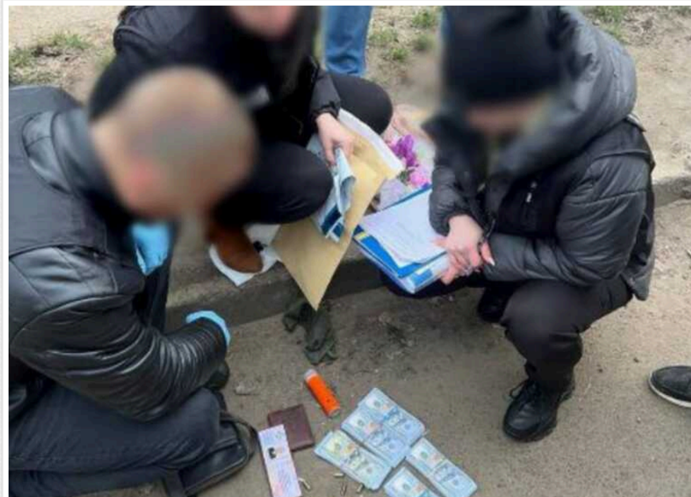
На Одещині викрито псевдоправоохоронця, який скоїв розбійний напад на волонтера і заволодів 50 тисячами доларів США

За процесуального керівництва Спеціалізованої прокуратури у сфері оборони Південного регіону повідомлено про підозру громадянина за фактом розбою (ст. 187 КК України).