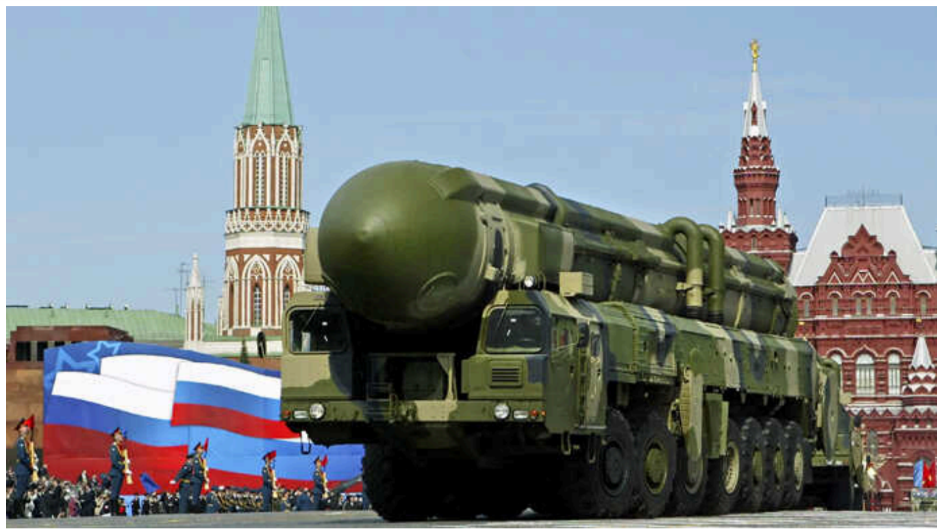
«Поріг» застосування РФ тактичної ядерної зброї нижчий за той, про який публічно говорять у Кремлі

Такий висновок робить газета Financial Times, яка пише, що ознайомила з документами армії РФ про можливість застосування тактичної ядерної зброї у разі війни з якоюсь великою світовою державою. Застосування ядерної зброї згідно з цією доктриною передбачено вже на ранній стадії конфлікту.