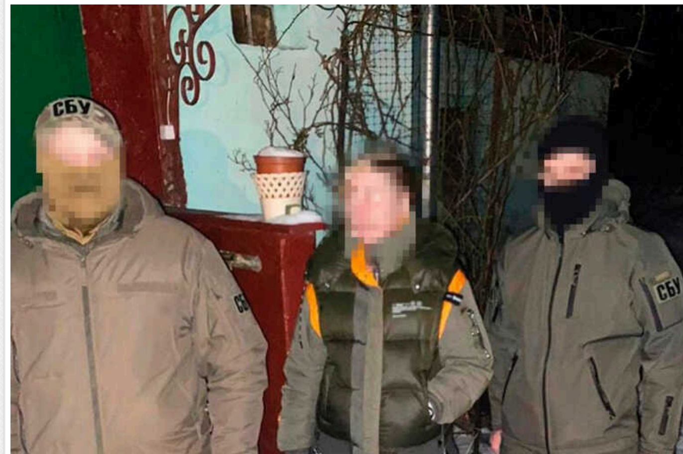
СБУ затримала чиновницю харківського університету: її підозрюють у передачі окупантам інформації про слабкі місця в обороні Харкова

Її спіймали вночі, коли вона проводила дорозвідку прифронтової місцевості Балаклійського району, намагаючись виявити та сфотографувати можливі об'єкти ЗСУ.