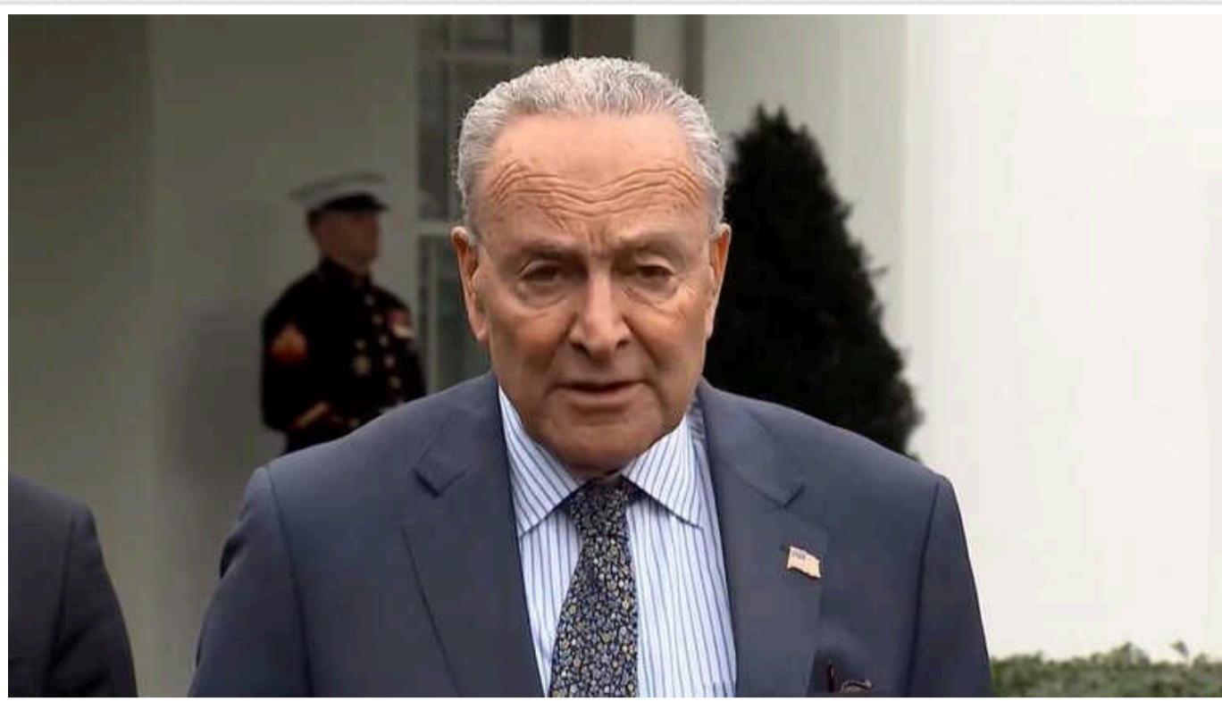
Без допомоги США Україна програє війну, а на НАТО може чекати розкол, – лідер демократів у Сенаті Чак Шумер

Лідер демократів у Сенаті Чак Шумер заявив, що Україна програє без допомоги США, після чого може розколиться НАТО.