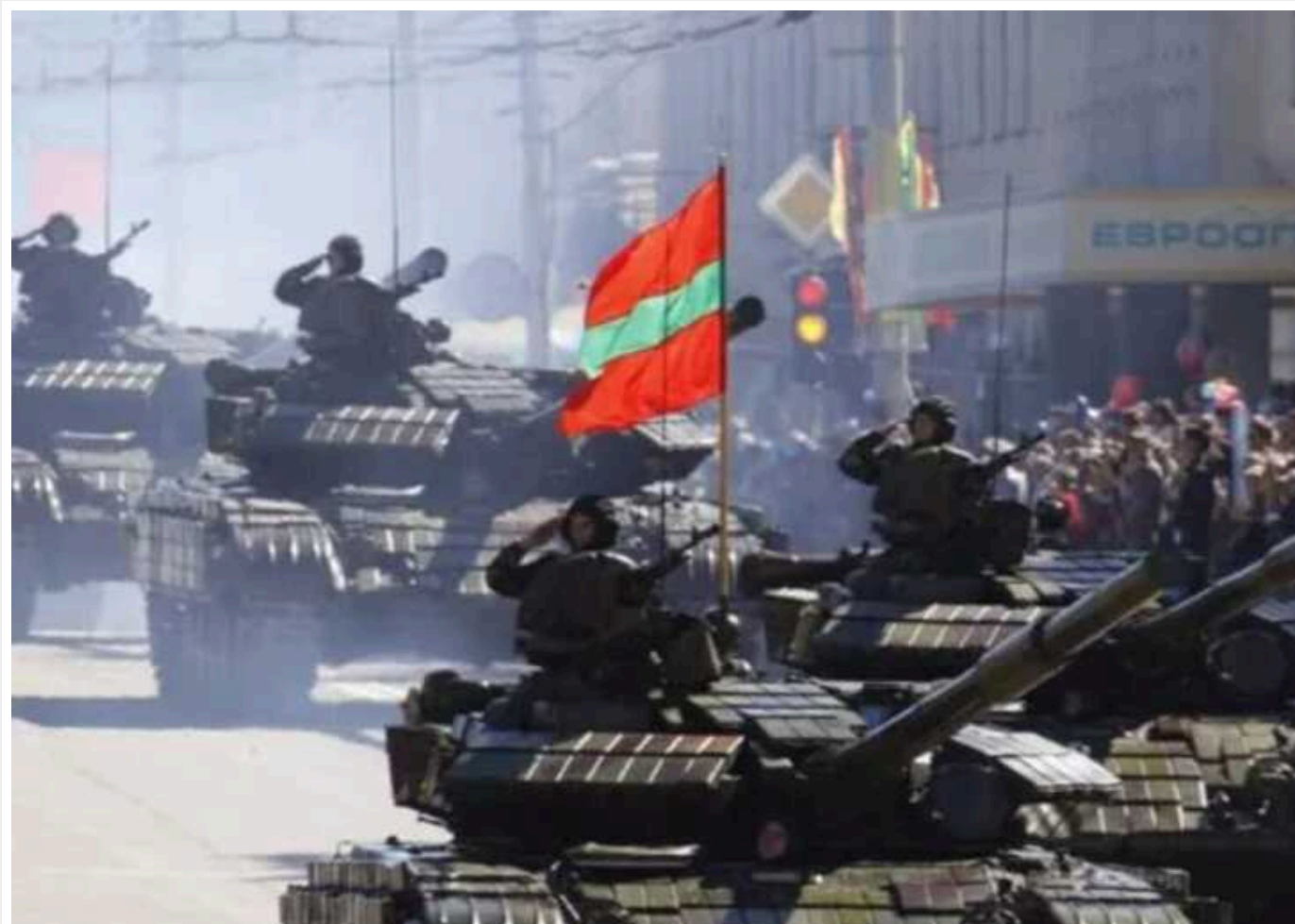
В ISW оцінили загрозу для України від Придністров'я і вказали на наслідки провокації Росії з прольотом дрона над територією Молдови

Події, що відбуваються у сепаратистському регіоні Молдови, Придністров'ї, навряд чи несуть військову загрозу для України. Однак вони з високою вірогідністю вплинуть на перспективи європейської інтеграції самої Молдови.