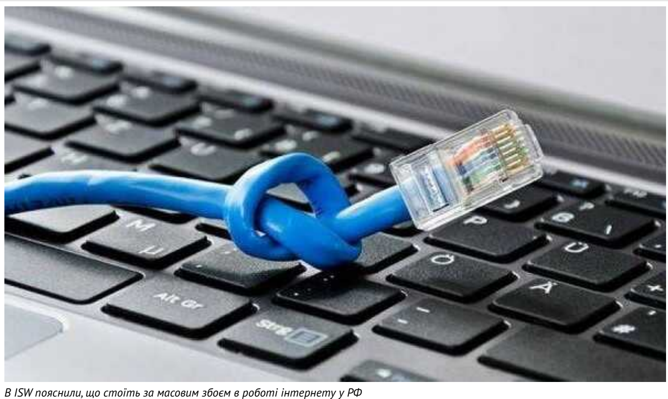
В ISW пояснили, що стоїть за масовим збоєм в роботі інтернету у РФ

У Росії 27 лютого було зафіксовано масштабний збій у роботі мережі Інтернет. Росіяни скаржилися на проблеми з Telegram, YouTube, "ВКонтакте" (ВКонтакте), Viber, WhatsApp і Zoom, які згодом відновили роботу.