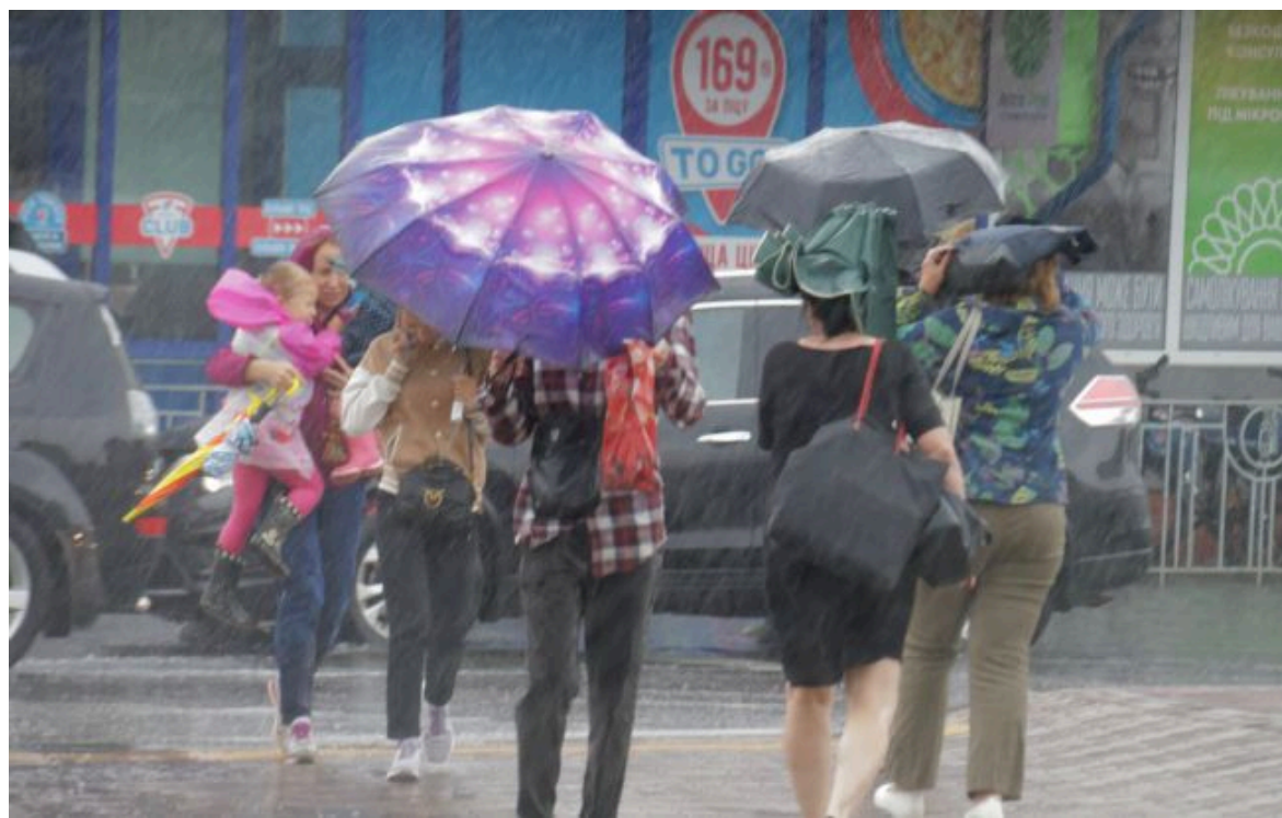
Фото: синоптик дала прогноз погоди на вихідні