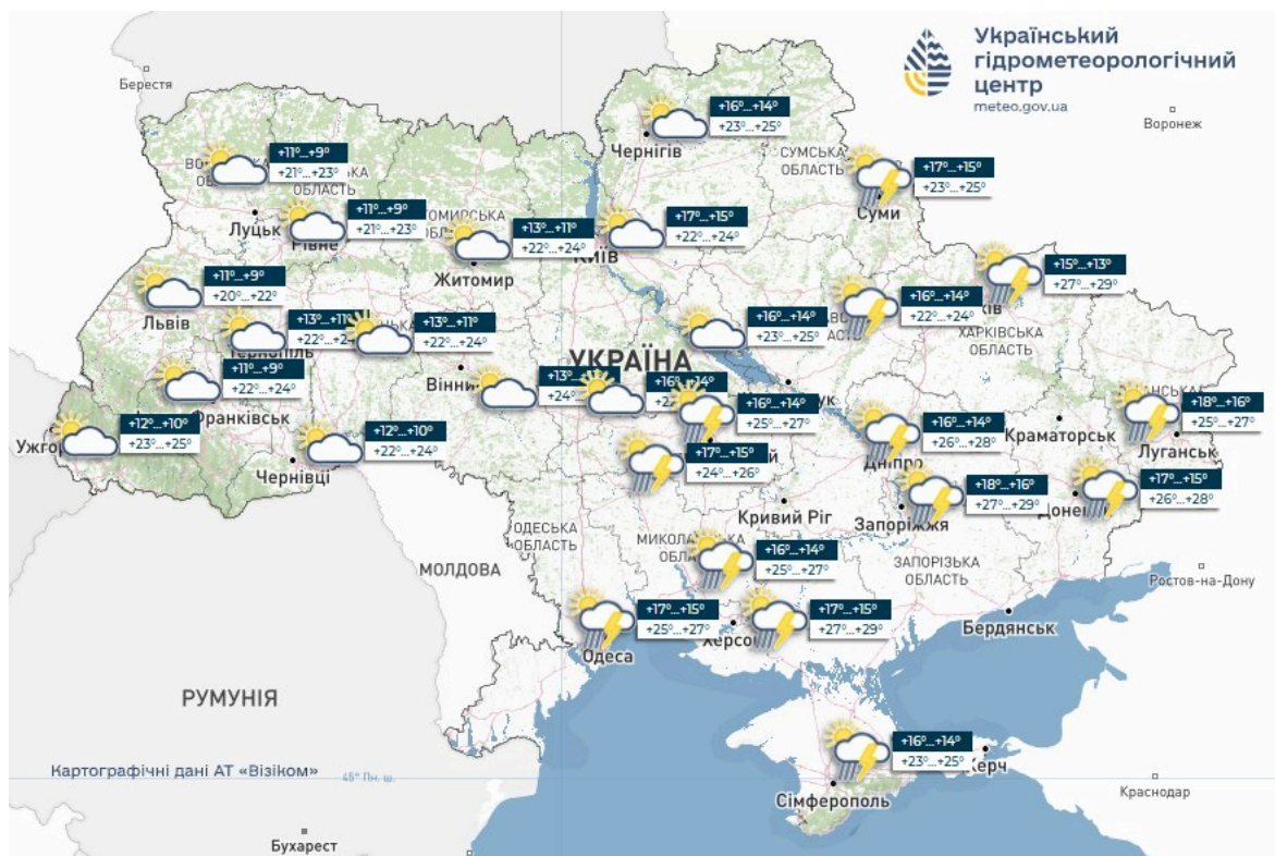
Фото: карта погоди в Україні на 23 травня