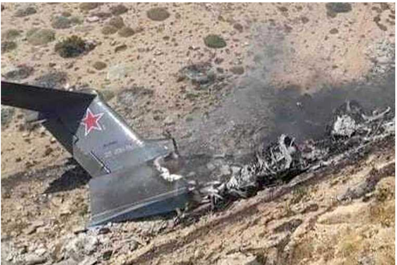
Завдяки чому ЗСУ почали частіше збивати російські літаки, – Defense Express

Останнім часом захисники українського неба збивають все більше російських винищувачів Су-34 та інших ворожих бортів. Найімовірніше, це стало можливим не через надходження певних типів зенітних ракет, а завдяки майстерності наших підрозділів протиповітряної оборони.