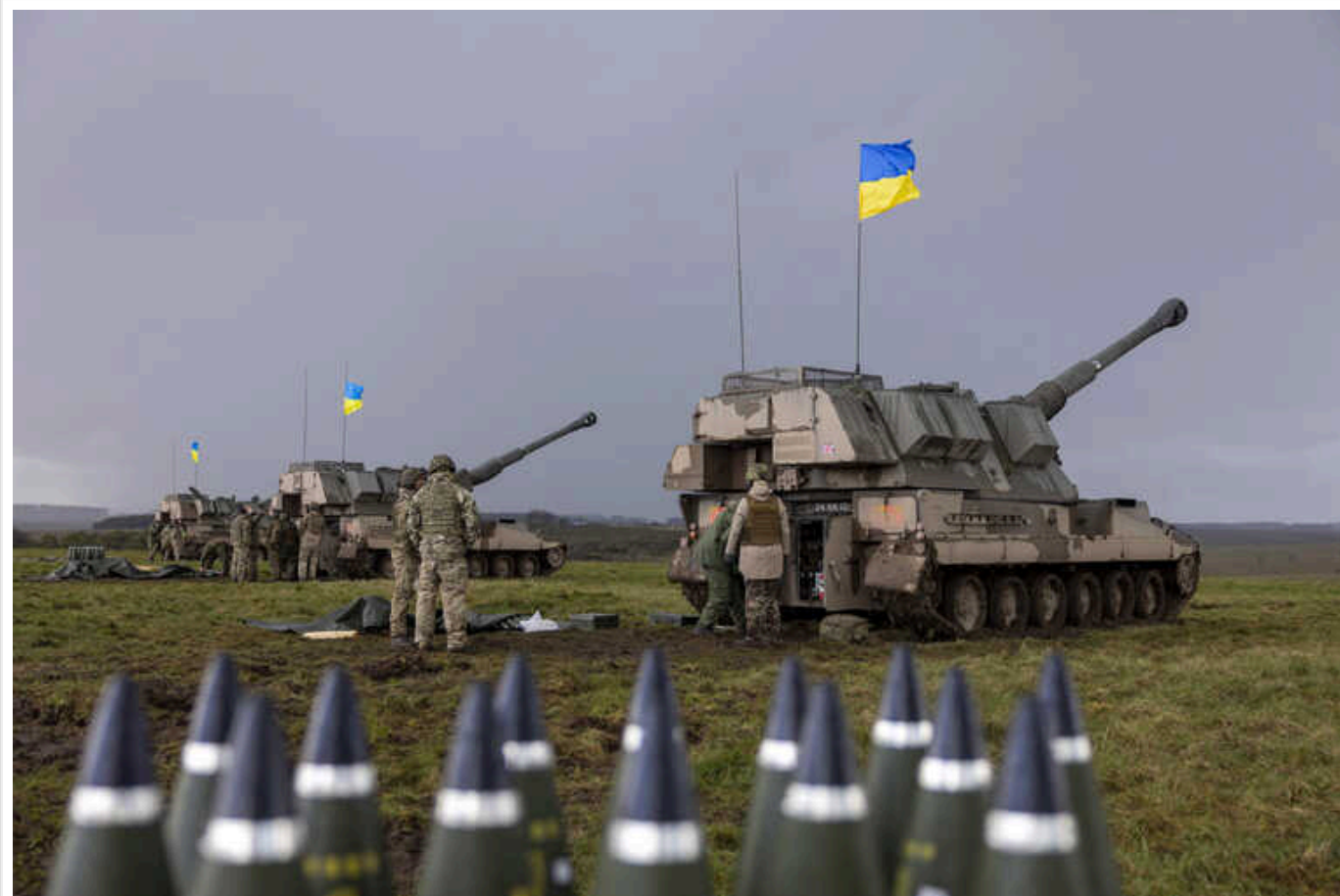
У Білому домі оцінили ситуацію на фронті та нестачу боєприпасів в Україні

Радник Білого дому з питань національної безпеки Джон Кірбі заявив, що ситуація на полі бою в Україні є "дуже жакливою". Через нестачу боєприпасів війнам Збройних сил України доводиться ухвалювати складні рішення.