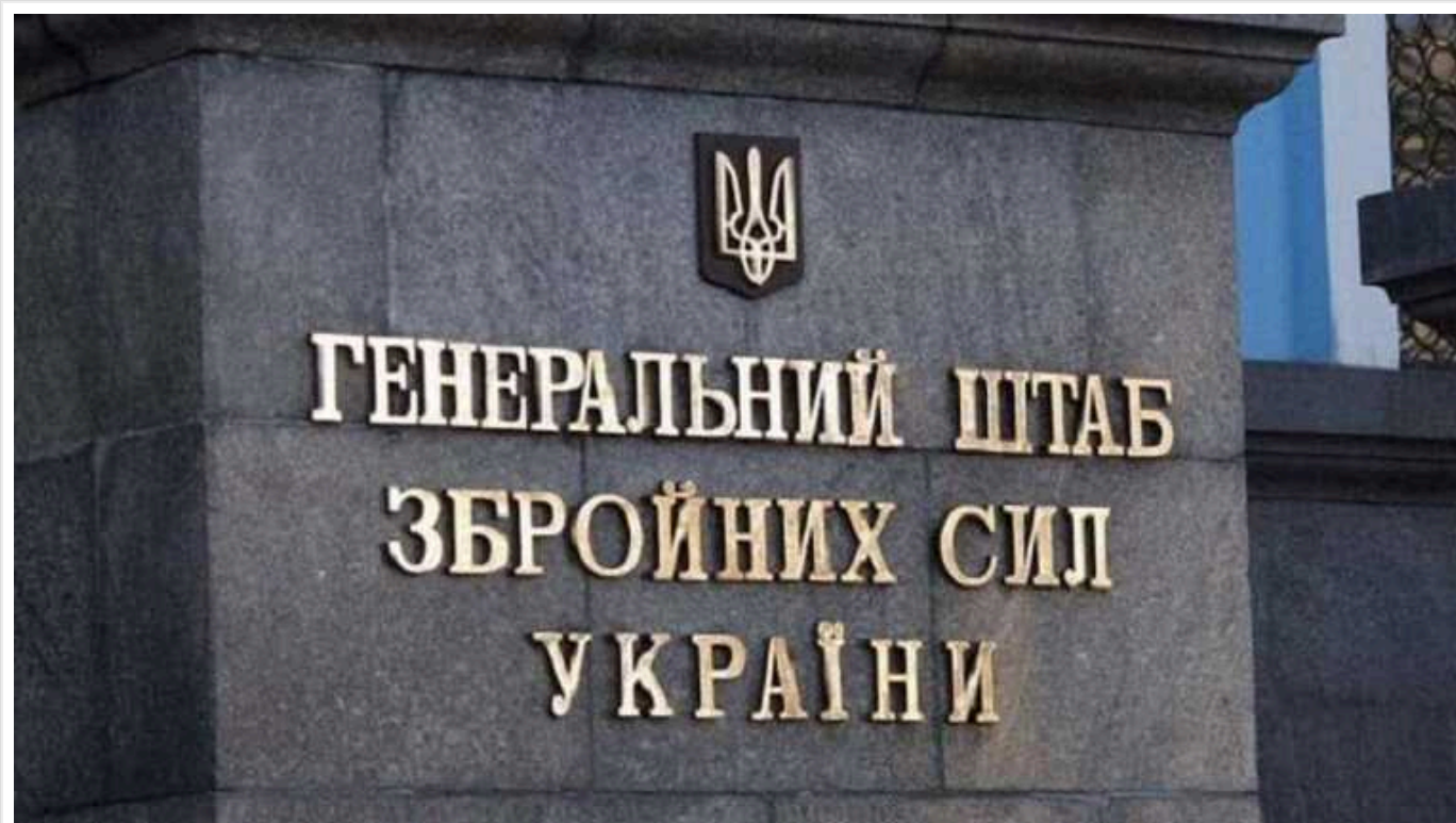
Генштаб України офіційно розшифрував цифри втрат окупантів у живій силі, які він дає у своїх щоденних зведеннях

Ці втрати не лише вбитими, а й пораненими (нагадаємо, до серпня 2023 року ГШУ заявляв, що до цифри входить лише "ліквідований" особовий склад, але потім змінив формулювання, коли цифра перевищила 255 тисяч осіб).