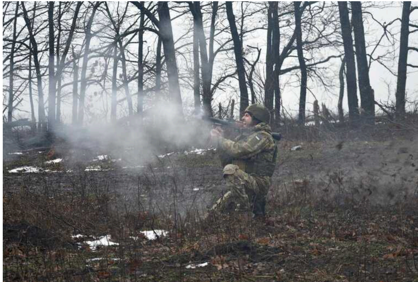
ISW: Росіяни тимчасово знизили темп своїх операцій під час зачистки Авдіївки

Вони підтримують відносно швидкий темп наступу, намагаючись просунутися до того, як ЗСУ збудують згуртованіші та складніші для проходження оборонні лінії в цьому районі.