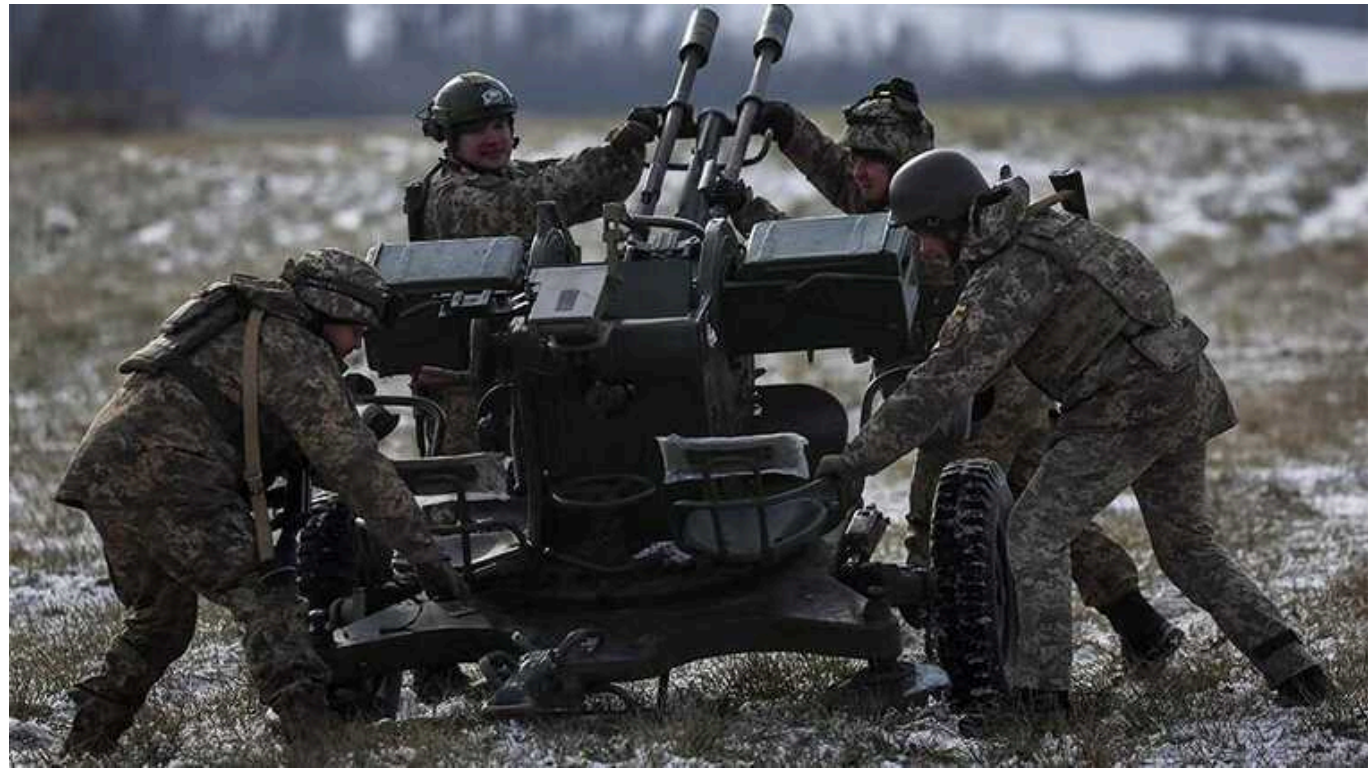
Ситуація на фронті: впродовж доби відбулося 102 бойових зіткнення

В Україні на фронті впродовж доби відбулося 102 бойових зіткнення. Загарбники продовжують тиснути на Авдіївському напрямку і суттєво активізувалися на Новопавлівському напрямку.