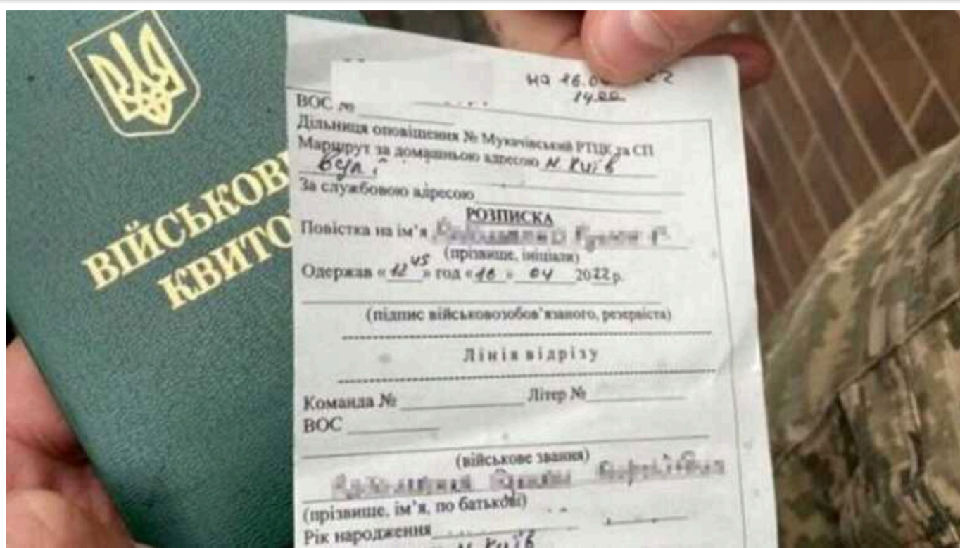
Що загрожує за неявку у військкомат після вручення повістки

В Україні під час дії режимів загальної мобілізації та військового стану передбачено покарання за неявку до Територіального центру комплектування та соціальної підтримки (колишній військкомат) після отримання повістки. Воно може бути адміністративним чи навіть кримінальним.