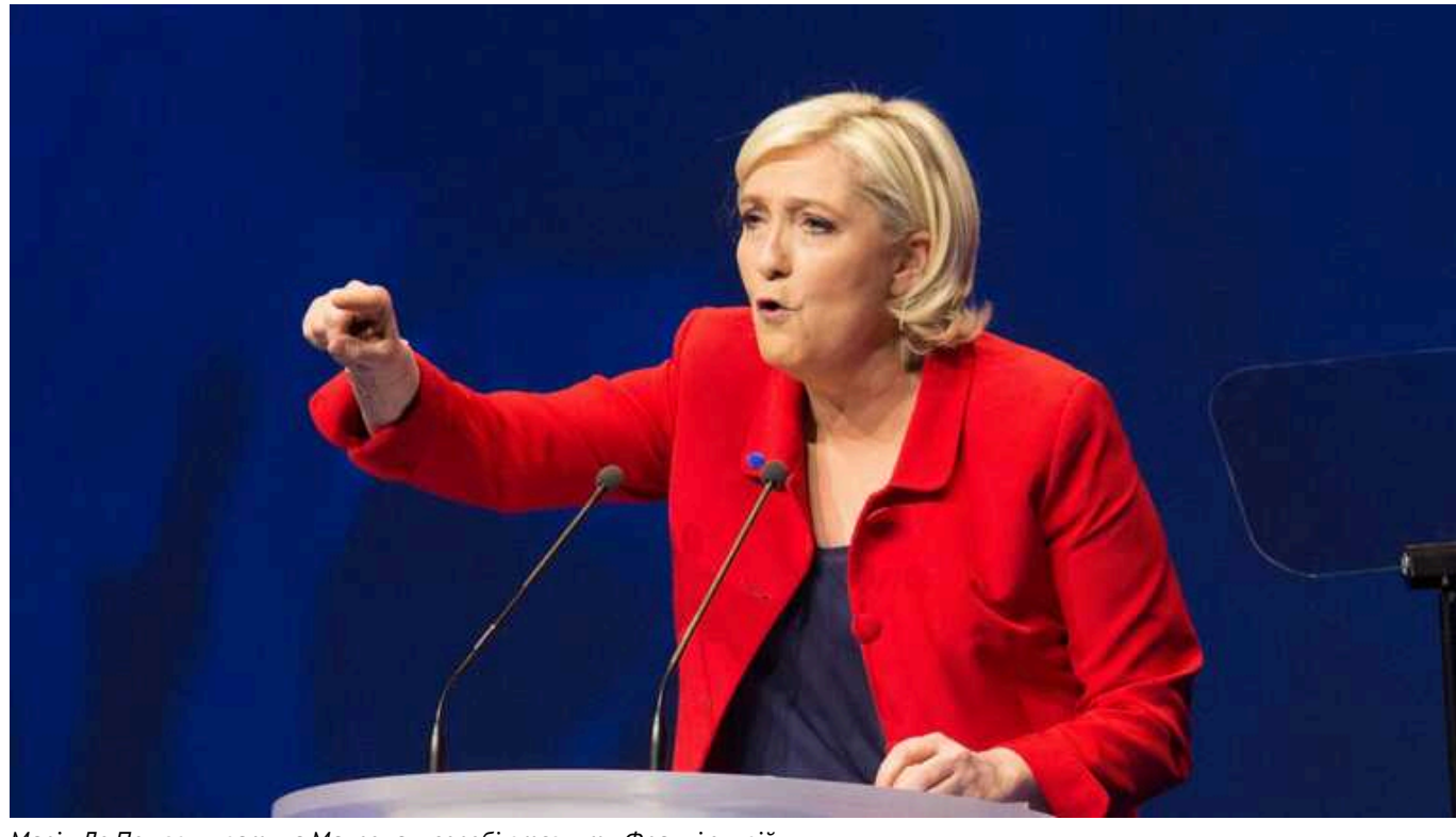
Марін Ле Пен звинуватила Макрона у спробі втягнути Францію у війну

Свої звинувачення вона висловила після заяви про відправку військ в Україну.