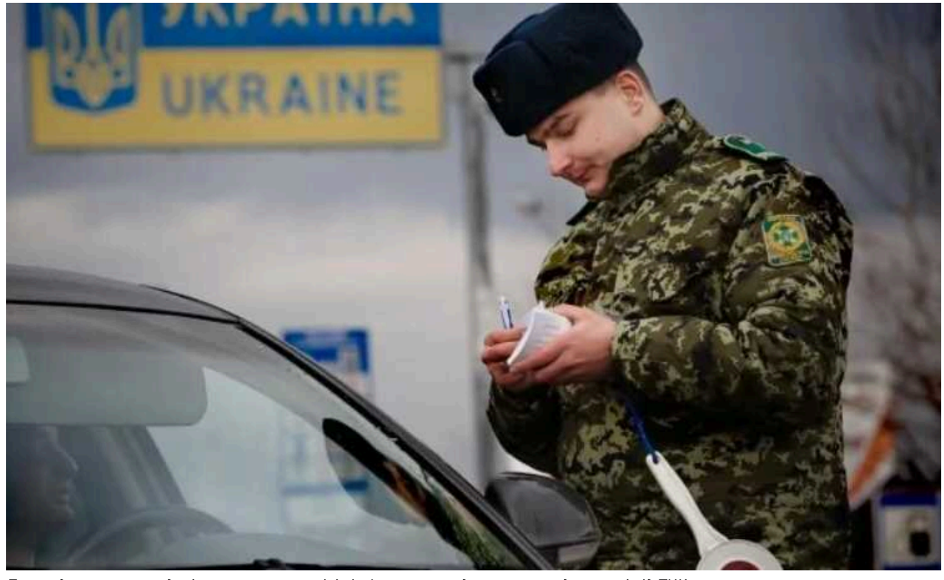
Прикордонники на кордоні затримали чоловіків із фальшивими документами для втечі від ТЦК

Один із порушників купив фальшивий висновок медичної комісії через наявність нібито "гіпертонії". Другий став багатодітним батьком за 5 днів до виїзду за кордон.