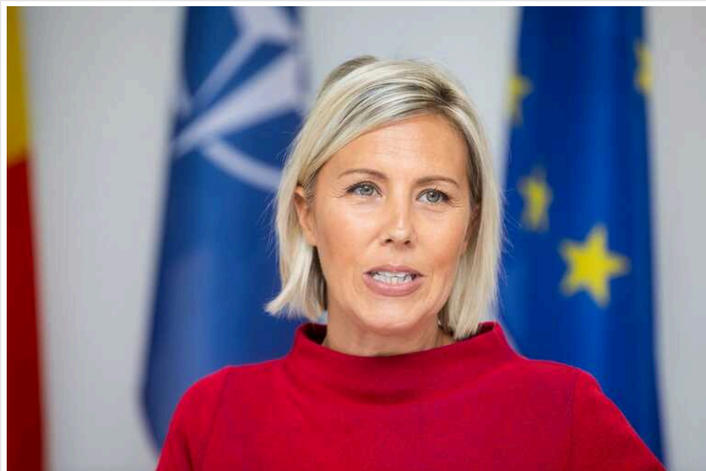
Бельгія продовжуватиме допомагати Україні, але не відправлятиме свої війська

Бельгія продовжить надавати Україні військову та фінансову допомогу, але свої війська на фронт не відправлятиме.