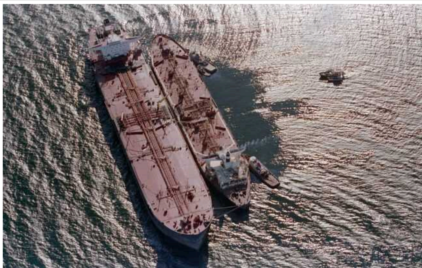
Bloomberg: Нові санкції США знову змогли призупинити перевезення російської нафти

Два нафтові танкери припинили свої дії біля берегів Греції всього за кілька днів після того, як США запровадили нові санкції щодо 14 російських кораблів.